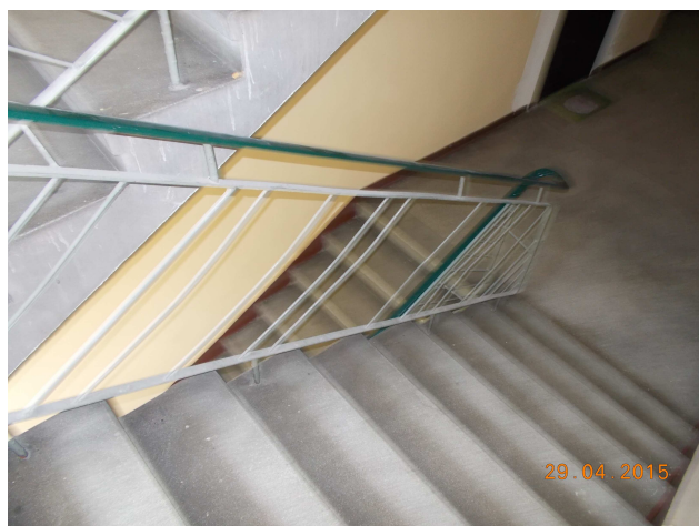
Fot. nr 7 Balustrady wewnętrzne, schody