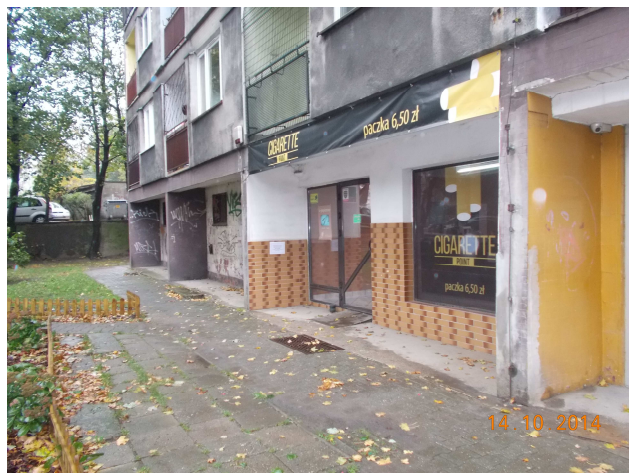
Fot. nr 5 Elewacja- warstwa fakturowa, balustrady zewnętrzne