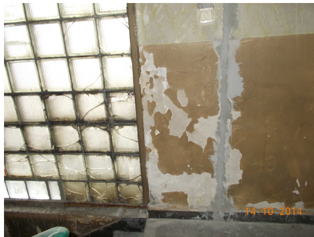
Fot. nr 10 Stolarka okienna, tynki wewnętrzne, malowanie