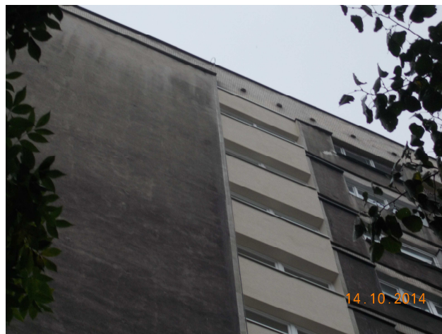
Fot. nr 6 Elewacja- warstwa fakturowa, stolarka okienna