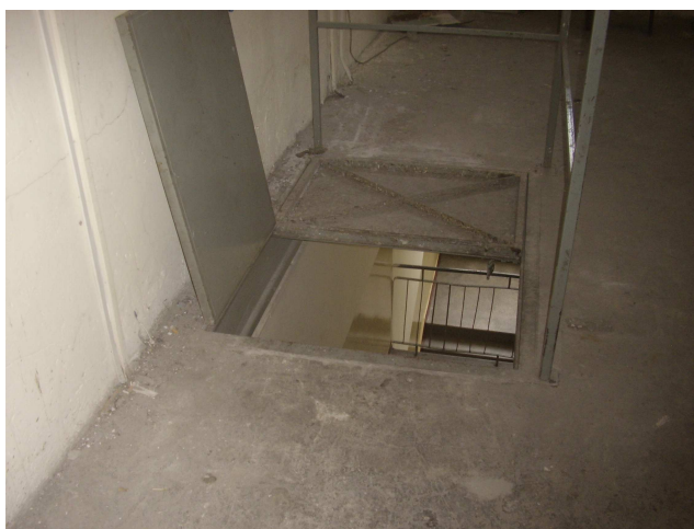
Fot. nr 16 Wylaz dachowy