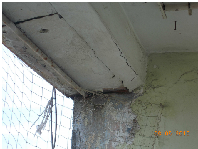
Fot. nr 2 Balkony- loggie, wieńce