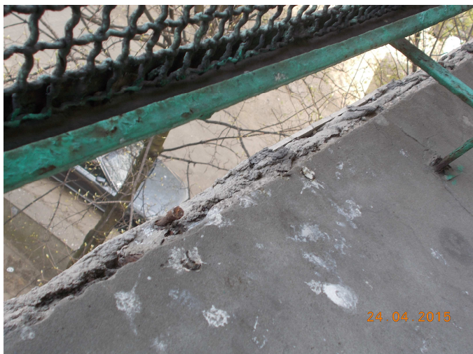
Fot. nr 1 Balkony- loggie, balustrady, obróbki blacharskie