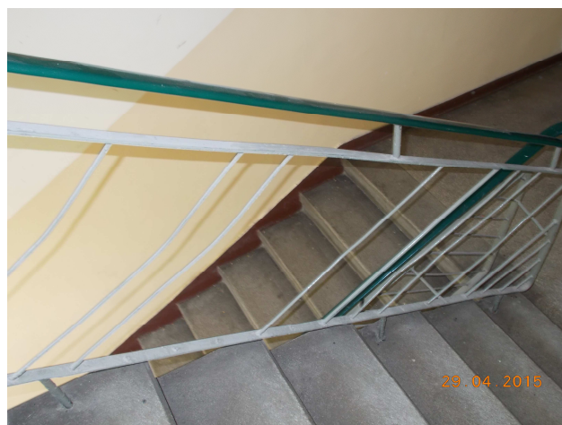
Fot. nr 8 Balustrady wewnętrzne, schody