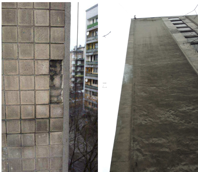
Fot. nr 13 Elewacja- warstwa fakturowa