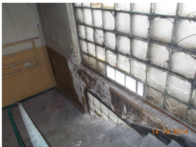
Fot. nr 11 Stolarka okienna, tynki wewnętrzne, malowanie