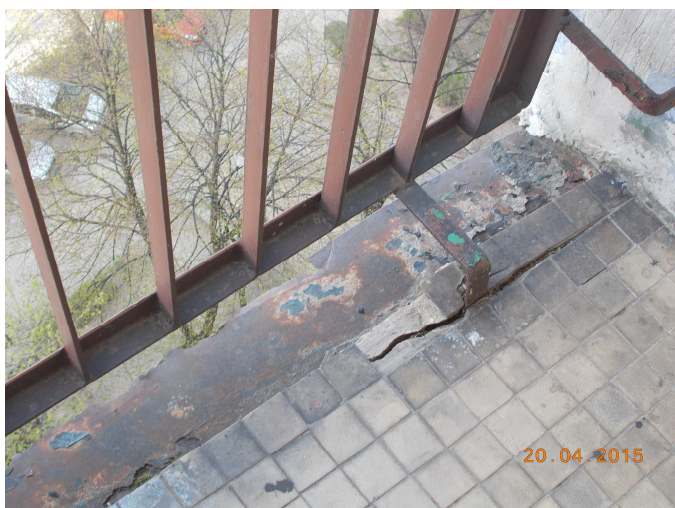
Fot. nr 3 Balkony- loggie, balustrady zewnętrzne, obróbki blacharskie