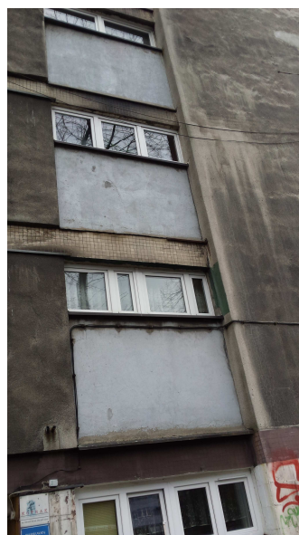
Fot. nr 12 Elewacja- warstwa fakturowa, obróbki blacharskie