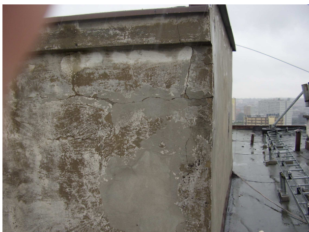
Fot. nr 15 Dach, kominy ponad dachem