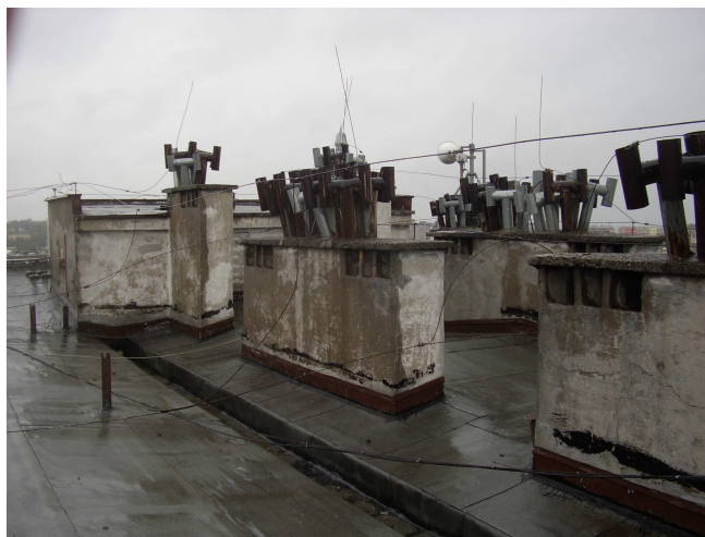
Fot. nr 14 Dach, kominy ponad dachem, rura spustowa