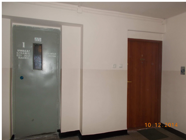
Fot. nr 9 Malowanie wewnętrzne